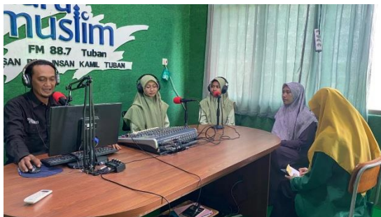
Gambar 1. Pelaksanaan Program Tahfidz On-Air di Studio Radio

Dengan demikian, pelaksanaan Program Tahfidz On-Air berbasis radio di MA Sains Bina Insan Kamil Tuban menunjukkan bahwa kegiatan ini dilakukan dengan terencana, sistematis, serta didukung oleh persiapan teknis dan bimbingan guru yang berkelanjutan.